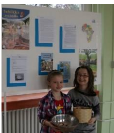
Zbierka Tehlička pre Afriku