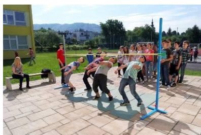
Podliezanie pod lano