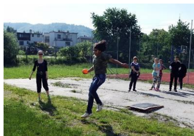
Skok vysokod'aleký s diskom