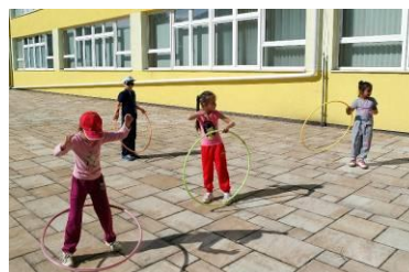
Točenie kruhom HULA – HOP