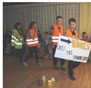
„Útek“ sa ôsmakom vydaril