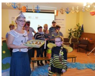
Odmena za masku