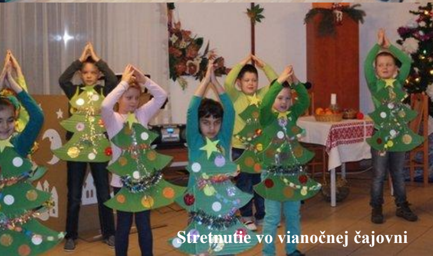
Stretnutie vo vianočnej čajovni