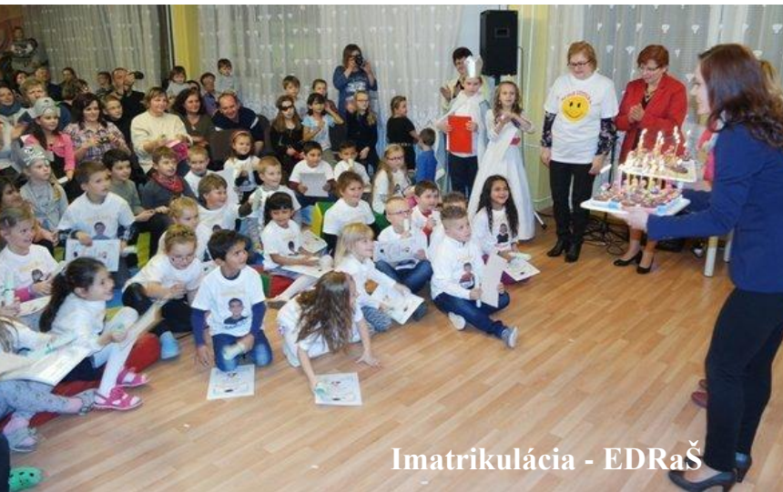
Imatrikulácia - EDRaŠ