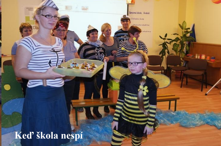
Keď škola nespí