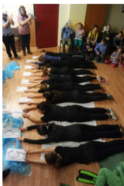
Deviatci ako čiarový kód