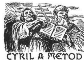
CYRIL A METOD

Cyril a Metod priniesli v roku 863 na naše územie jazyk - staroslovienčinu a písmo – hlaholiku, ktorému rozumeli naši ľudia. Začali vyučovať svojich žiakov. Rímski kňazi po Rastislavovom oslepení a jeho vyhnaní začali sprisahanie proti Konštantínovi, Metodovi a ich učencom a na trón dosadili Svätopluka. Konštantín šiel do Ríma, aby získal právomoc učiť tunajších ľudí. Pápe mu dal dve podmienky: musí sa pokrstiť ako rímskatolík a prijať nové meno Cyril. Po Cyrilovej smrti sa Metodovi aj učencom podarilo preložiť do staroslovienčiny Bibliu. Potom nastalo veľké ticho. Veľká Morava sa rozpadla, všetci tvrdia, že na príbehu troch Svätoplukových prútov. Už tieto prvopočiatky vzniku nášho národa svedčia o tom, že všetko zlo, ktoré museli naši predkovia prežiť a vytrpieť, bolo posilnením do ďalšieho vývoja, ľudia sa nevzdávali a usilovali sa zachovať svoju identitu i svoj jazyk, ktorému najlepšie rozumeli.