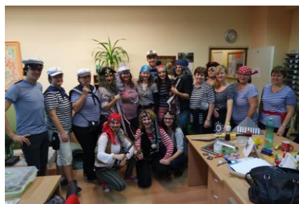
Ani učitelia sa nedali zahanbiť