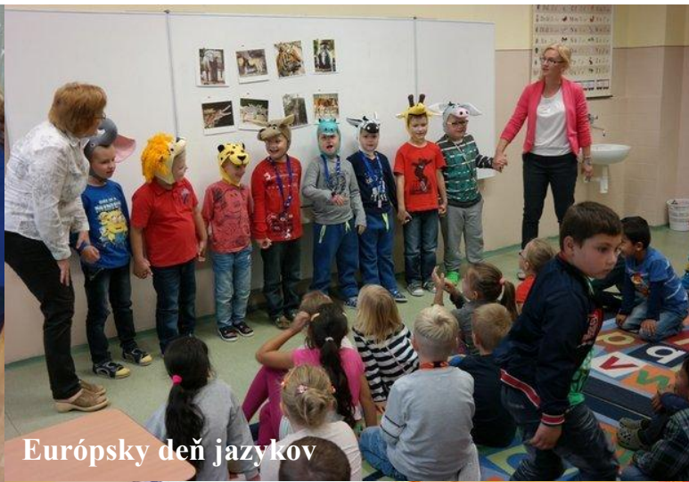
Európsky deň jazykov