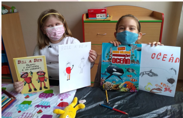
Pomáhame žiakom porozumieť financiám!